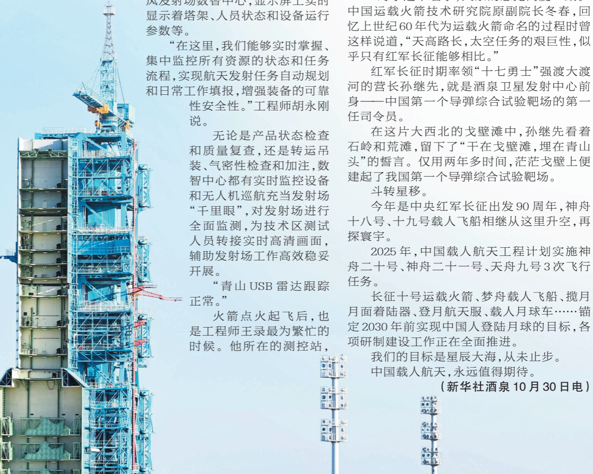
2024年10月22日下午,神舟十九号载人飞船与长征二号F遥十九运载火箭组合体在垂直转运中。