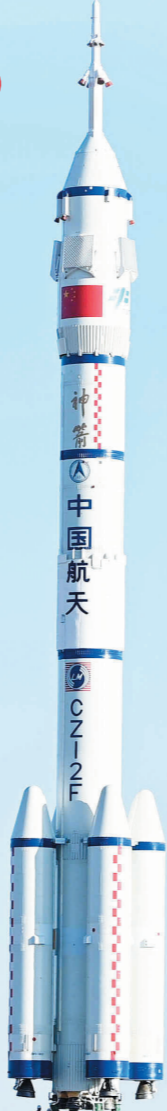
2024年10月22日下午,神舟十九号载人飞船与长征二号F遥十九运载火箭组合体在垂直转运中。