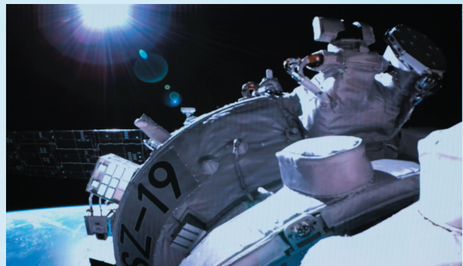
10月30日在北京航天飞行控制中心拍摄的神舟十九号载人飞船和空间站天和核心舱前向端口对接过程的画面。

按任务计划,3名航天员随后将从神舟十九号载人飞船进入空间站天和核心舱。神舟十八号航天员乘组已做好迎接神舟十九号航天员乘组进驻各项准备工作。