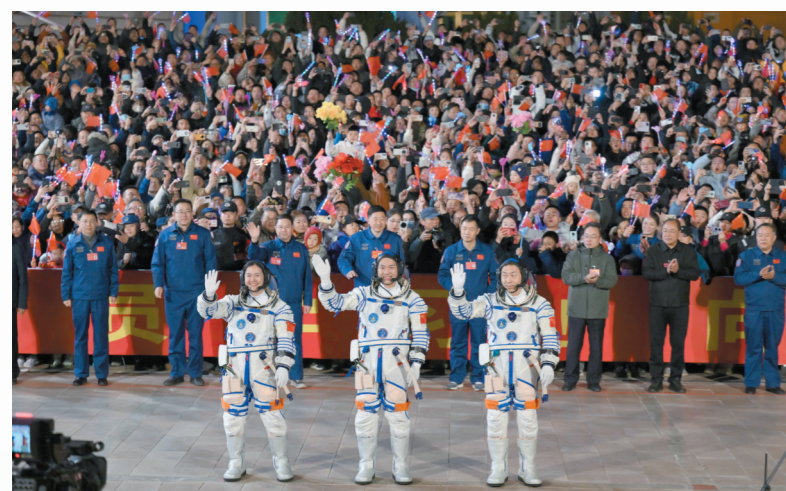
2024年10月30日,神舟十九号载人飞行任务航天员乘组出征仪式在酒泉卫星发射中心问天阁圆梦园广场举行。这是航天员蔡旭哲(右)、宋令东(中)、王浩泽在出征仪式上。