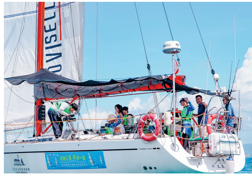
青少年在专业教练的保驾护航下扬帆起航。

本报讯(记者 黄珍 刘盈盈)近日,“龙腾三亚 清凉一夏”三亚帆船夏令营研学游体验活动在三亚半山半岛帆船港举办。活动邀请40余位青少年及其家长参与帆船体验,拥有ASA签证资质的教练员对青少年进行专业培训。