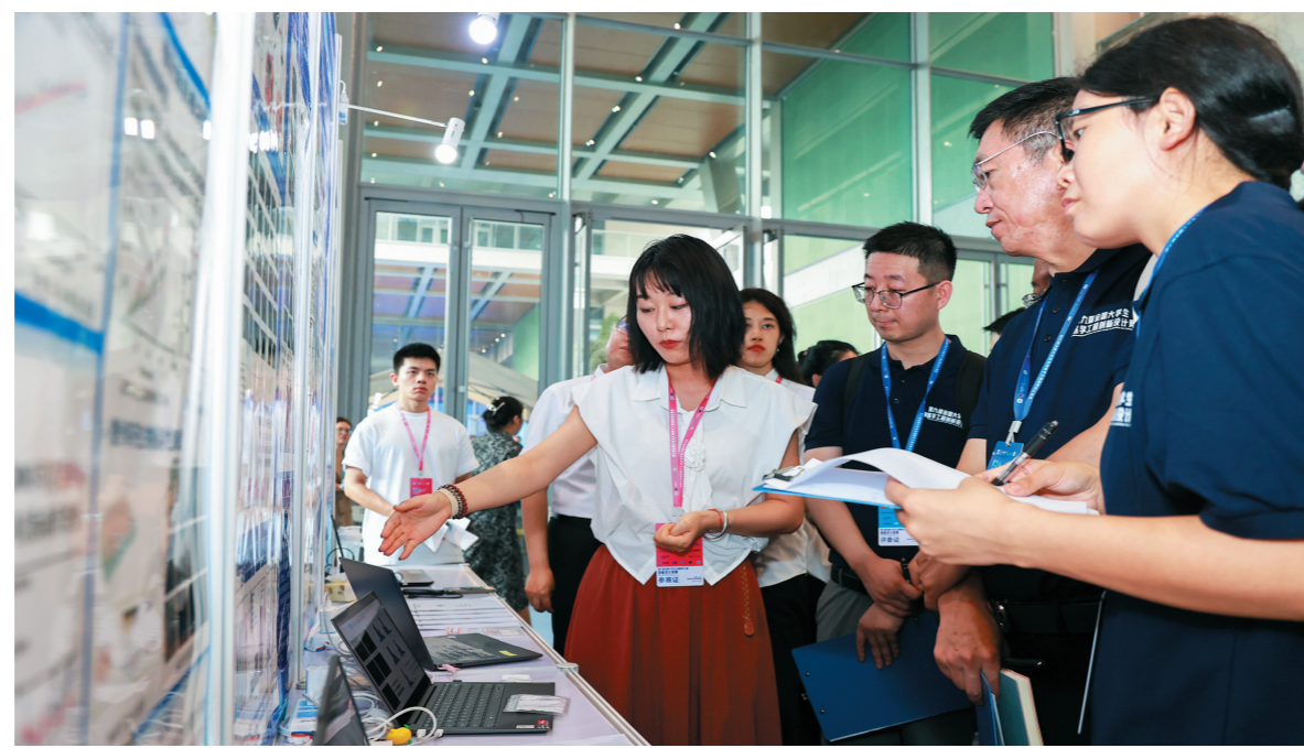
7月22日,第九届全国大学生生物医学工程创新设计竞赛现场,参赛选手向评委组专家介绍参赛作品。

本届竞赛包括理论研究、方案设计、实际制作、系统调试、现场展示等环节,要求学生组成项目团队,协同工作,初步体验生物医学工程学科相关的研究开发项目从设计到实现的全过程。