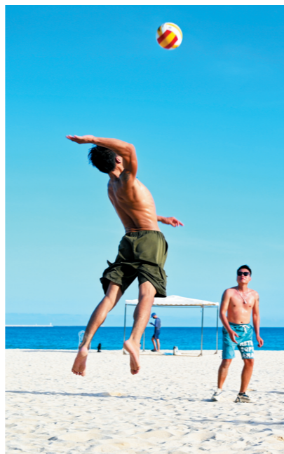
游客在大东海海边打沙滩排球。