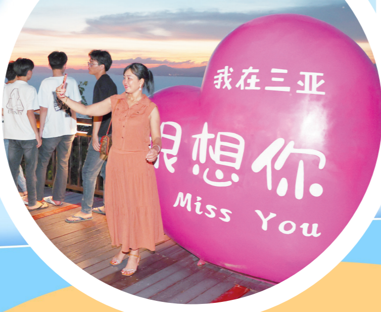
一句“我在三亚很想你”,道出三亚的热情好客。

荣登“夜游主题公园”排名前十的三亚海棠湾梦幻海洋不夜城积极策划,根据“80后”亲子家庭、“95后”Z世代人群等不同客群的兴趣点及市场消费动向,精心打造极具夏季清凉、夜游特色的“冰爽戏水季”“海棠湾小小旅行家”等活动。同时,该景区作为“海南省中小学生研学实践教育基地”、首批“三亚全域旅游研学旅行实践教育基地”,依托自身在海洋动物资源与保育方面的优势,开发“小小保育员”“小小科普讲解员”“小小潜水员”等课程,让孩子们学有所得、学有所乐。