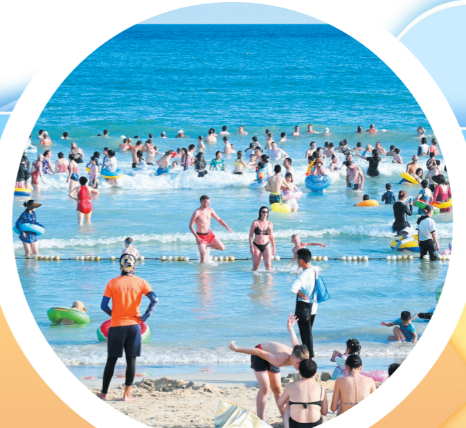
大东海海边人潮如织。