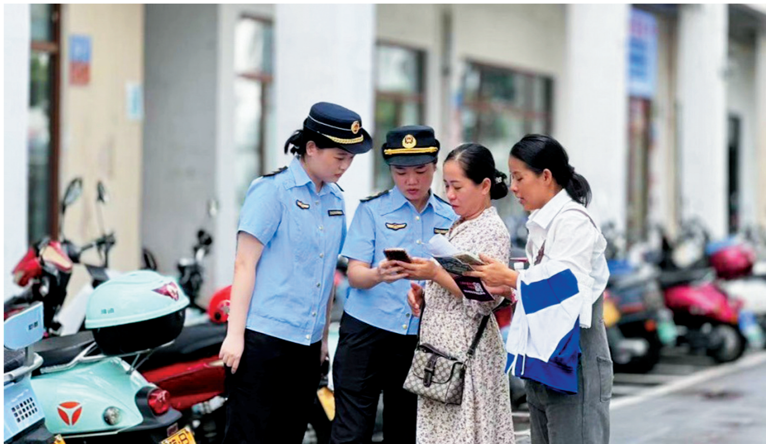
“白鹭”女子执法队执法人员为游客提供服务。

市综合行政执法局在坚持依法行政、保证执法力度、认真履行城市管理职责的同时，通过宣传教育、劝导纠正、主动疏导等措施对流动摊贩开展柔性执法。截至目前，已在全市设立36个便民疏导点，采取劝导为主、疏堵结合的方式，教育劝导流动摊贩入点经营，变被动管理为主动服务，将宣传引导与柔性执法相结合，让市民群众感受到管理有“尺度”、执法有“温度”，不断增强人民群众的获得感、幸福感、安全感。