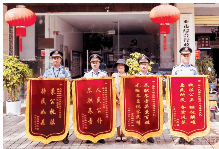
群众给执法人员送锦旗。