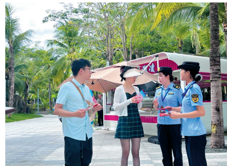
“白鹭”女子执法队执法人员进景区开展普法宣传活动。