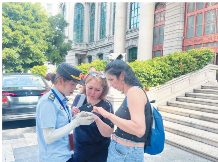
“白鹭”女子执法队执法人员为两名俄罗斯游客提供服务。