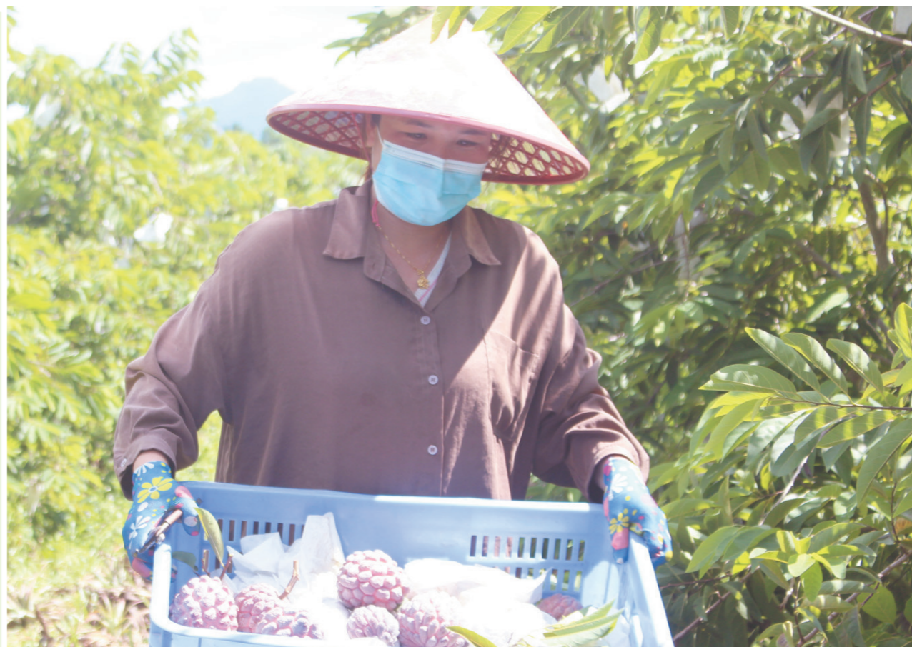
育才生态区那受村种植基地内,工作人员正在采摘、打包紫色释迦果。

他和村民们会守候在田地,及时帮我排除积水。这里的生态环境优美,阳光充足,大家对我非常关爱,这让我觉得就像是置身于梦中的理想家园。