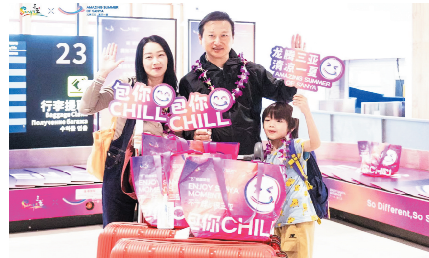
来自香港的一家展示收到的礼包。

本报讯(记者 刘盈盈 李少云)7月1日10时19分,由香港快运航空执飞的UO250航班抵达三亚凤凰国际机场。国际到达行李传送带旁,提取行李的香港旅客均收到了一份来自三亚的“见面礼”——Chill礼包。