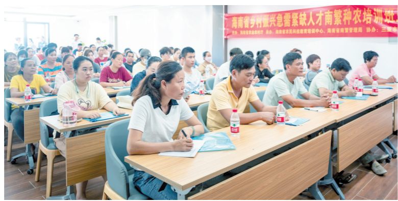
南繁种农实训基地举办首期培训班。

将认真落实市委、市政府有关要求,不断完善南繁种农实训基地和南繁就业驿站管理工作机制,充分发挥基地的培训作用和驿站的就业服务平台作用,激活新农人创新创业活力。同时做好人才“引育