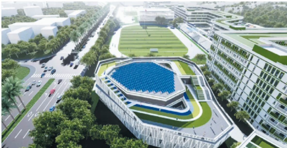
三亚迎宾学校整体效果图。

据悉,三亚迎宾学校作为巴蜀中学教育集团在海南的深度布局,将依托巴蜀中学强大的办学实力和资源优势,在承袭巴蜀中学90余载深厚教育底蕴和卓识智慧的基础上,践行“公正诚朴”的教育信念,实施覆盖小学、初中、高中完整的12年一贯制教育。学校将由来自重庆巴蜀中学的管理团队率领一批巴蜀专家常驻三亚,主持学校的管理和教学工作,并在全国招募一支素质过硬、富有激情和创新精神的教师队伍。新教师在前往重