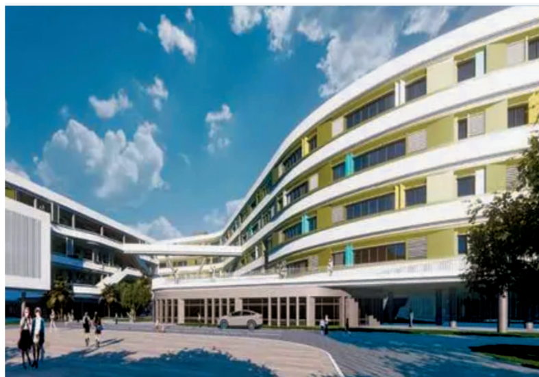
三亚迎宾学校校园效果图。

近年来,三亚始终坚持以新发展理念为引领,以资源均衡配置为重点,以体制机制改革为动力,以提高教育质量为核心,致力于打造“学在三亚”品牌,不断夯基础、挖内涵、激动力、补短板,缓解主城区中小学学位供需压力,推动教育规划项目建设,提升学校教育教学质量,强化教育治理能力,提升教研队伍引领教师专业发展能力,推动教育数字化建设,奋力推动三亚教育取得更大更实的发展成果。