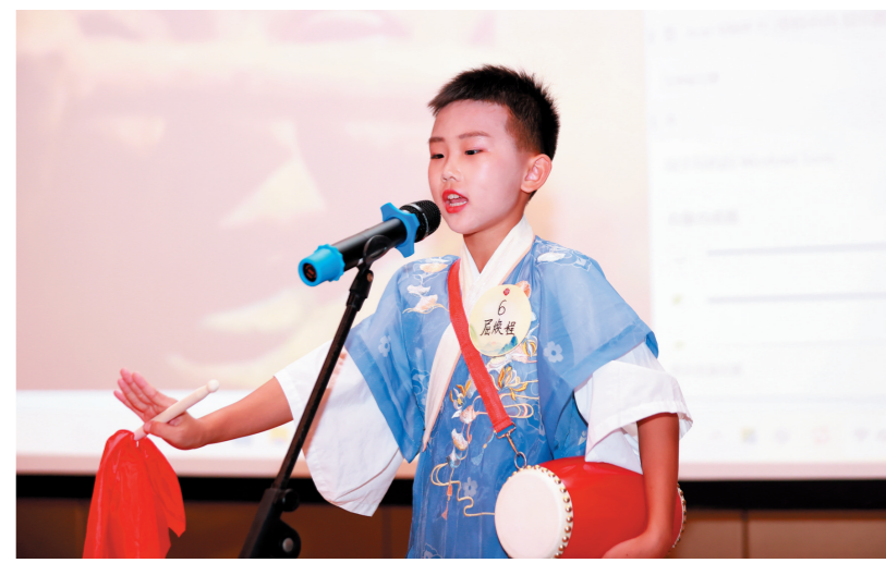
一名选手在《国学传承人》栏目三亚城市决赛活动现场进行才艺展示。

本报讯(记者 袁永东)3月26日,中国教育电视台《国学传承人》栏目三亚城市决赛在三亚亚龙湾华宇度假酒店举行。比赛现场,身穿传统汉服的参赛选手轮流上台进行才艺表演和国学答题,精彩的表演让现场不时响起阵阵热烈掌声。