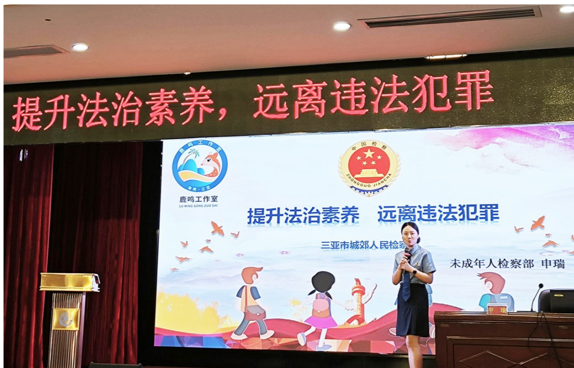
检察官走进校园给学生们进行法治专题讲座辅导。

吉阳区丹州小学将心理健康作为安全教育的主题,通过让学生分享课余生活、写心里话等方式,帮助学生建立积极的心态。