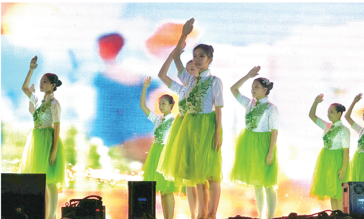
学生们积极参加各项文体活动。

在市教育局的领导下,学校被评为“海南省文明校园”,学校以“六个好”文明校园为基础,着力打造书香校园、健康校园、平安校园、科技校园,为学生营造文明和谐的校园环境。