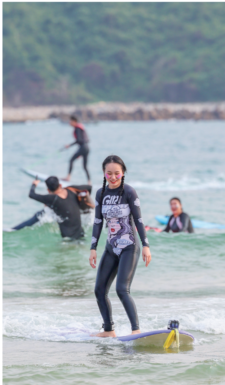
3月13日,在三亚市海棠区藤海社区后海村,游客在海上体验冲浪运动。

方备受年轻一代的追捧,带动了相关产业的快速发展,成为经济社会发展发展的新动能。当前,冲浪板、桨板、滑雪板「新三板」运动蓬勃兴起。近年来,冰雪运动热潮吸引更多南