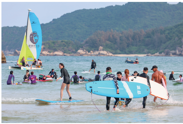
3月13日,在后海村海边,前来体验冲浪运动的游客络绎不绝。