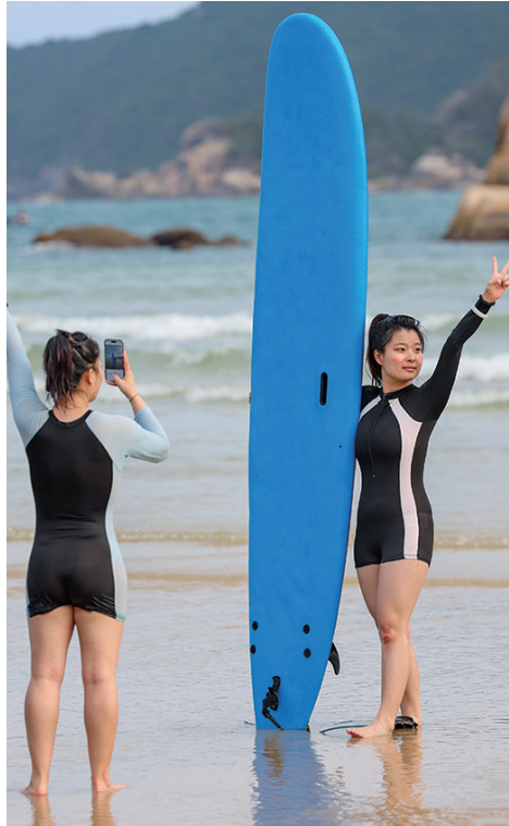
3月13日,在后海村海边,游客在拍照打卡。