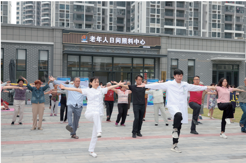
义诊团队带领老年人一起做呼吸康复操。

本报讯(记者 冯晨阳)三月春风“暖”,“益”起学雷锋。3月7日,吉阳区月川社区老年人日间照料中心联合三亚市人民医院(四川大学华西三亚医院)开展学雷锋暨“文明实践我是行动者”义诊活动,为