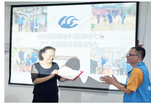
一名志愿者(左)获“最美志愿者”纪念证书。

此次活动进一步提升了志愿服务的社会认可度和影响力,进一步激励志愿者普及和推广志愿服务的理念,吸引更多人参与志愿服务。