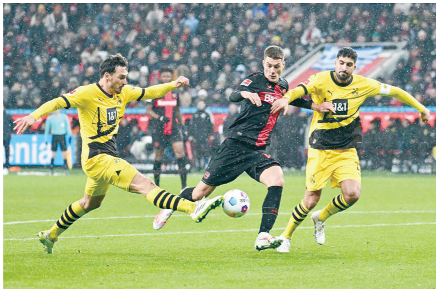
12月3日,勒沃库森队球员希克(中)与多特蒙德队球员胡梅尔斯(左)和埃姆雷·詹在比赛中拼抢。

新华社柏林12月3日电(记者刘畅)2023-2024赛季德甲联赛3日进行第13轮的三场比赛,“领头羊”勒沃库森队主场1:1战平多特蒙德队,终止在各项赛事的14连胜,继续保持在积分榜首位。