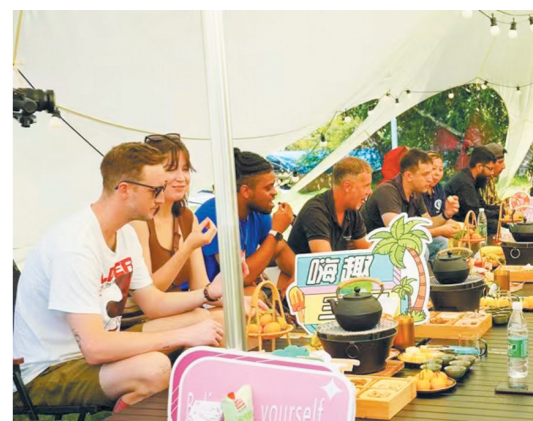
外籍人才分享各自的工作生活。

委通过三会一课、专题研讨、工作例会等,开展集中学习54次;梳理公共服务事项和办理流程,明确124项公共服务事项清单,努力做到一次办好,真正让群众“少跑腿”;依托大社区综治中心,建立人民调解委员会,把矛盾纠纷化解在萌芽状态;构建社区、社会组织和社会“三社联动”服务模式,提升社区服务群众的能力;深入开展各项“走心”的惠民便民志愿服务;常态化开展理论宣讲、民俗文化、健康普及、爱心义诊、爱心帮扶、人居环境整治等文明实践活动;协助办理退役军人优待证申请200余人次,增强退役军人的归属感、荣誉感;搭建基层协商民主议事平台,架起基层协商服务群众的“连心桥”,开展基层协商议事4次。