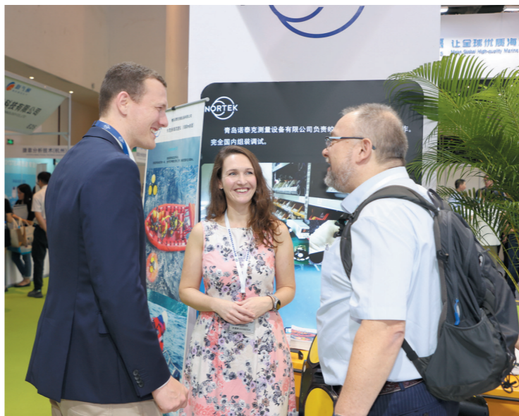
与会学者嘉宾在展会现场交流。

11月8日,2023国际海洋科学技术装备设备展览会在三亚举行。据悉,展览会吸引来自全球的130余家知名品牌企业参展,涉及海洋科技产业中的设备制造、配套厂商、技术服务、工程承包以及科学研究全产业链等领域。