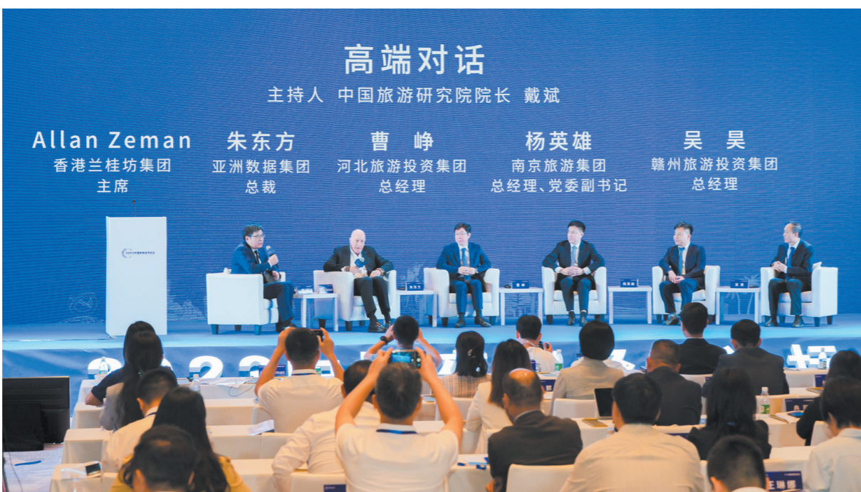
10月11日,2023中国夜间经济论坛在三亚举办,业界专家在进行高端对话。

“这次我们邀请了行业内的一些领军人物,从世界各地来到三亚实地考察,就如何成功打造‘地标性’夜间经济进行经验分享,让三亚可以探索发展更多的夜间经济业