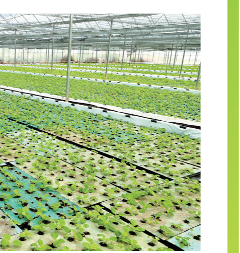
天涯区过岭文门常年蔬菜基地水培蔬菜设施大棚。

取得良好经济效益 三亞水培蔬菜 8月30日,在天涯区过岭文门常年蔬菜基地水培蔬菜设施大棚内,来自云南的一名菜农正在进行水培小白菜育苗移植。 据介绍,近年来,该蔬菜基地打破传统地种种植方式,大胆运用水培技术,新建水培蔬菜大棚60多亩,该水培系统不破坏土壤原有结构,实现营养液循环使用,具有生长更快,更绿色,产量高等特点,是一种绿色环保种植方式。每茬水培蔬菜亩产量达2000多斤,取得了良好的经济效益。