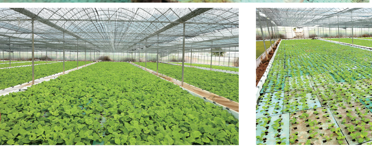
天涯区过岭文门常年蔬菜基地水培蔬菜设施大棚。

取得良好经济效益 三亞水培蔬菜 8月30日,在天涯区过岭文门常年蔬菜基地水培蔬菜设施大棚内,来自云南的一名菜农正在进行水培小白菜育苗移植。 据介绍,近年来,该蔬菜基地打破传统地种种植方式,大胆运用水培技术,新建水培蔬菜大棚60多亩,该水培系统不破坏土壤原有结构,实现营养液循环使用,具有生长更快,更绿色,产量高等特点,是一种绿色环保种植方式。每茬水培蔬菜亩产量达2000多斤,取得了良好的经济效益。