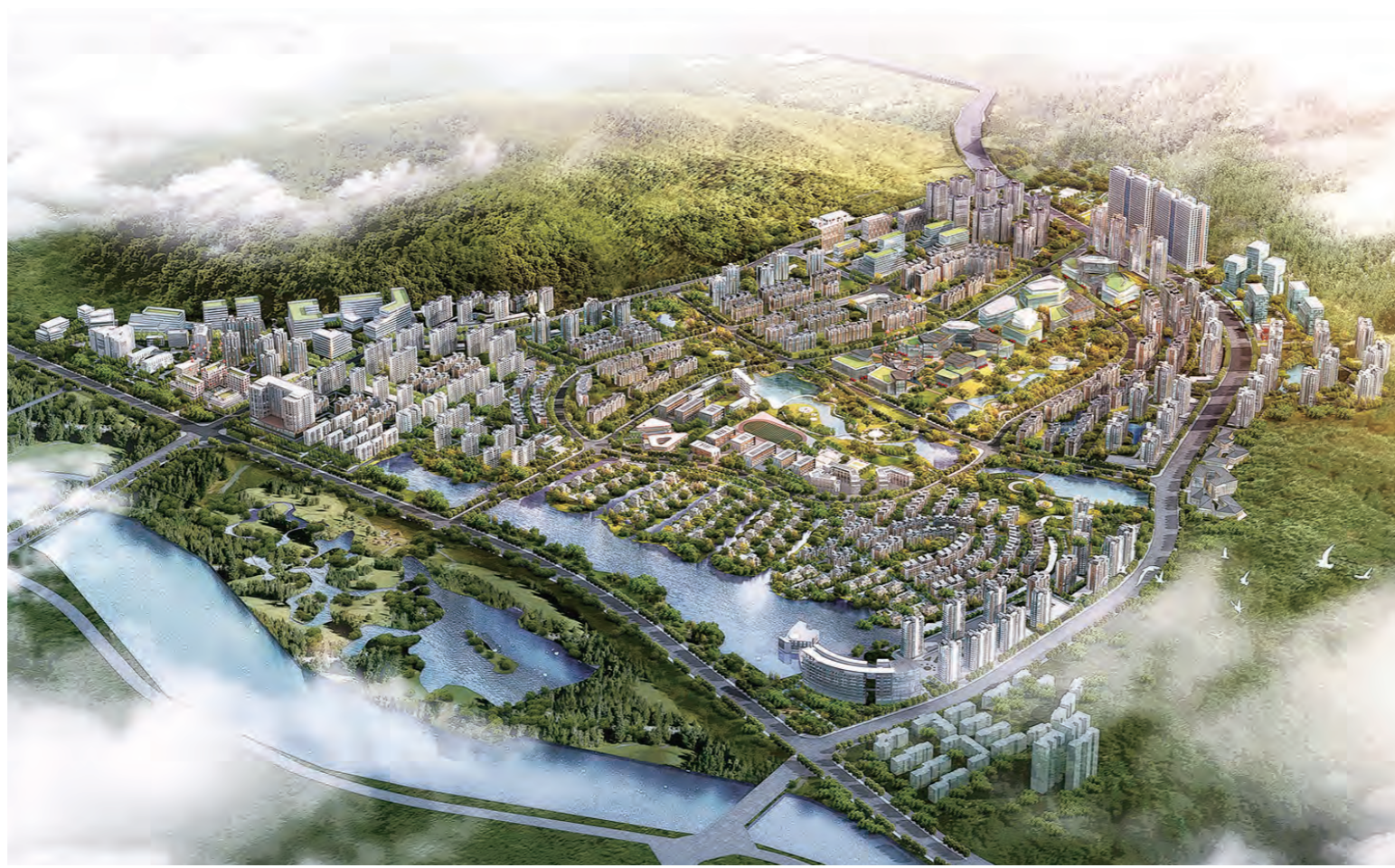
临春片区城市设计鸟瞰图。

在规划范围内,城市建设用地面积为160.23公顷,根据用地布局来看,居住用地占比最高,共72.13公顷,占规划区建设用地总量的45.02%;排在第二位的是绿地与开敞空间用地27.45公顷,占规划区建设用地总量的17.13%;紧随其后的是交通运输用地26.42公顷,占规划区建设用地总