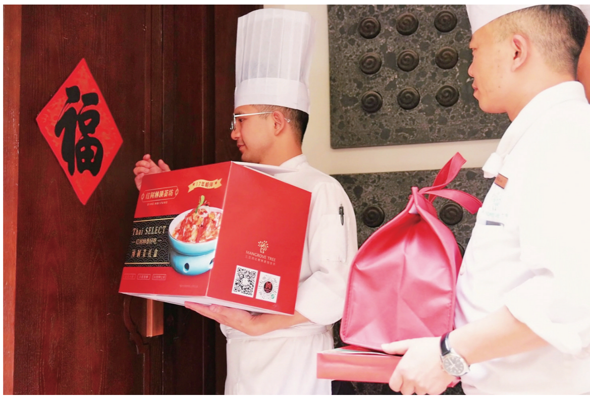
三亚红树林酒店星厨准备好预制菜食材,上门为消费者提供家宴服务。(资料图片)

为夯实产业链,在上游水产种苗方面,三亚正在建设三亚水产种苗南繁生态产业园,该产业园占地158.4亩,总投资4亿元,致力于打造集科研、生产、销售、科技交流、成果转化为一体的水产种苗南繁生态产业园。