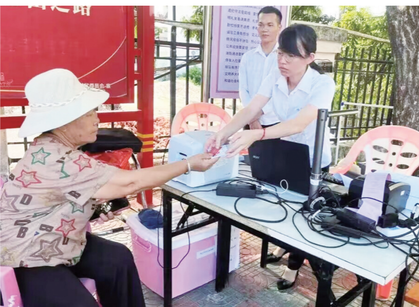
三亚“政务服务直通车”进驻天涯区马岭大社区服务群众。

下一步,马岭大社区将以“政务服务直通车”活动为契机,不断织密服务网络、提高服务效能,为群众提供更加便捷、高效、温馨的政务服务。