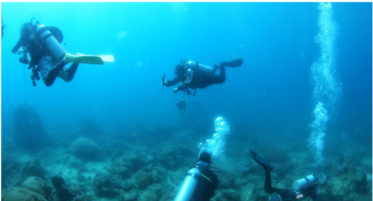
5月28日,水下摄影师在海底创作。

本报讯(记者 李少云)5月28日,首届2023年中国水下摄影公开赛在潜水胜地三亚蜈支洲岛旅游区启动。本次赛事是全国首次举办的国家级水下摄影大赛,同时也是作为2023年海南亲水运动季系列赛事活动以及2023海南国际潜水节的重点赛事,吸引了来自国内外近40名顶尖潜水员和摄影爱好者参加。