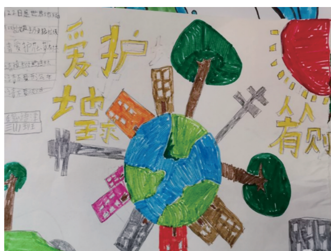
学生用绘画和手抄报的方式描绘美丽的地球。

本报讯(记者 李少云 通讯员 胡丽齐)4月22日是世界地球日,当天上午,由蓝丝带海洋保护协会、三亚崖州湾度假村希尔顿格芮精选酒店联合组织的破拆废弃环保主题手工活动在三亚崖州湾科技城举行,吸引了周边学校学生及家长近60人参加。