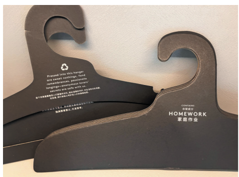
姓名:酒店衣架 曾用名:废纸架

由读书笔记、测试题及图纸回收制作而成的衣架独具教育意义,引发思考。成为情书的衣架藏着恋人们甜蜜的记忆、彼此温情的守护和对生活热切的渴望。