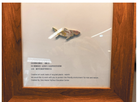
姓名:《重生》 曾用名:塑料瓶盖

由读书笔记、测试题及图纸回收制作而成的衣架独具教育意义,引发思考。成为情书的衣架藏着恋人们甜蜜的记忆、彼此温情的守护和对生活热切的渴望。