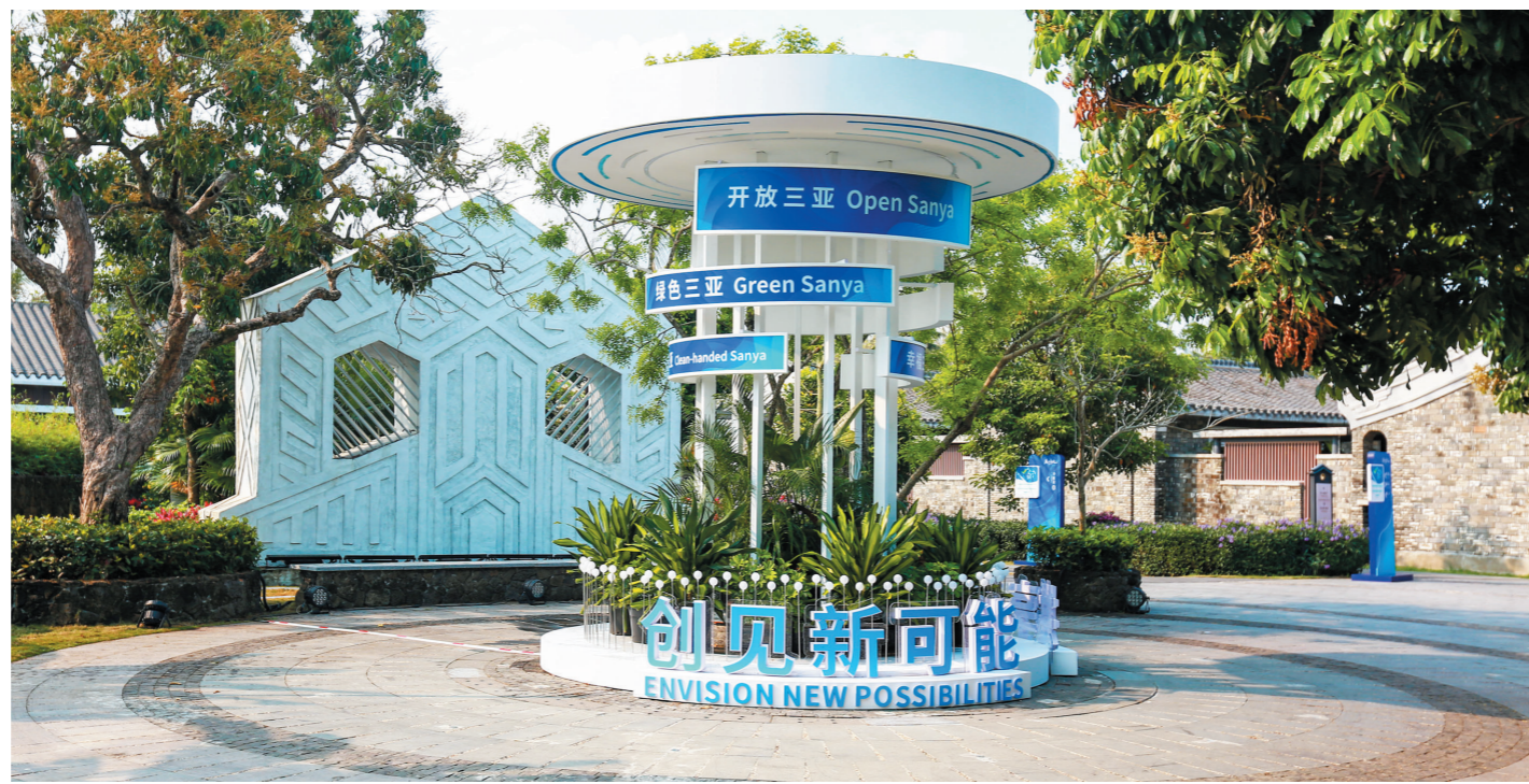
3月26日,“风从海上来”三亚创新发展主题展现场。

本报博鳌3月26日电(特派记者 李鑫 刘盈盈)阳春三月,草长莺飞,博鳌东屿岛文化公园一片生机盎然。3月26日,距离“风从海上来”三亚创新发展主题展(以下简称“主题展”)开门迎客还有2天,各项筹备工作有序推进,各展区展陈布置进入收官阶段。