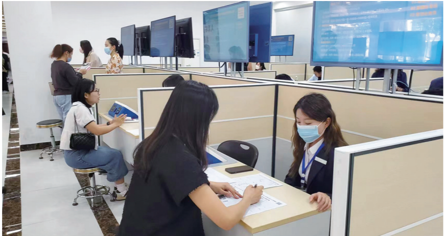
招聘会现场，求职者在填写资料。

满怀的诚意北上。82家企业提前一天便到达招聘现场——海南省人力资源开发局（省就业局）一楼公共招聘服务大厅“探访”，为次日的摆台招聘做准备。