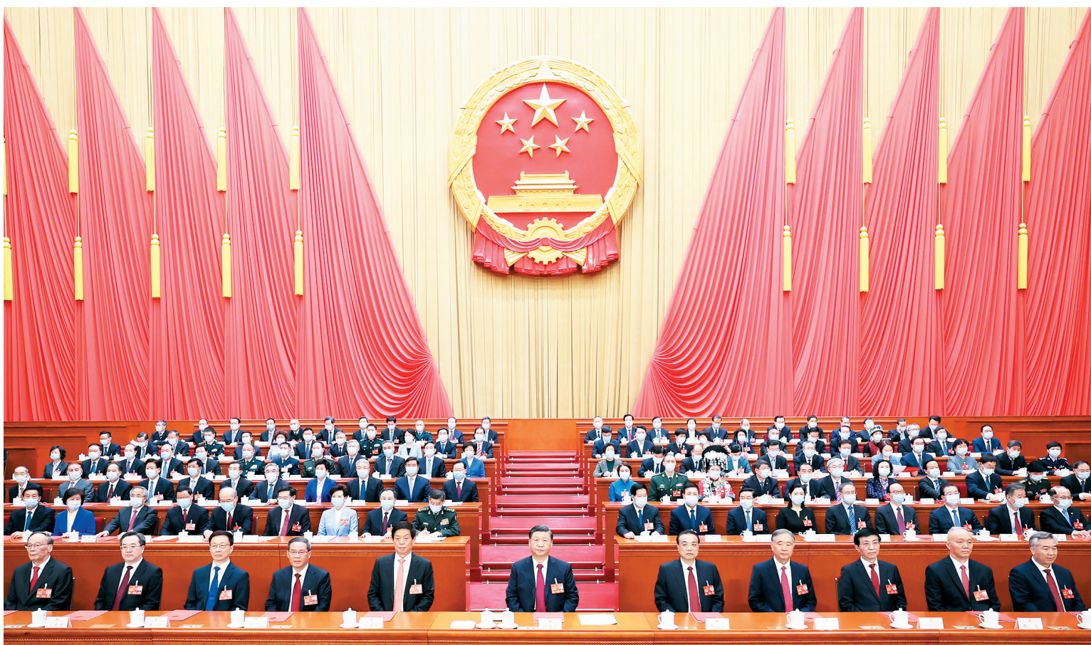
3月13日，第十四届全国人民代表大会第一次会议在北京人民大会堂闭幕。习近平等党和国家领导人在主席台就座。

新华社北京3月13日电 中华人民共和国第十四届全国人民代表大会第一次会议，在圆满完成各项议程，产生新一届国家机构组成人员后，13日上午在北京人民大会堂闭幕。