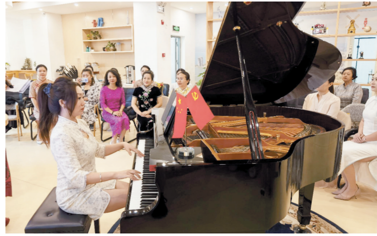
参加活动的女性朋友欣赏钢琴表演。

本报讯(记者 黄世峰 实习生 郑慧婷)3月6日,“书香政协·共筑天涯”暨“三八”妇女节主题活动在天涯区党群服务中心开展。