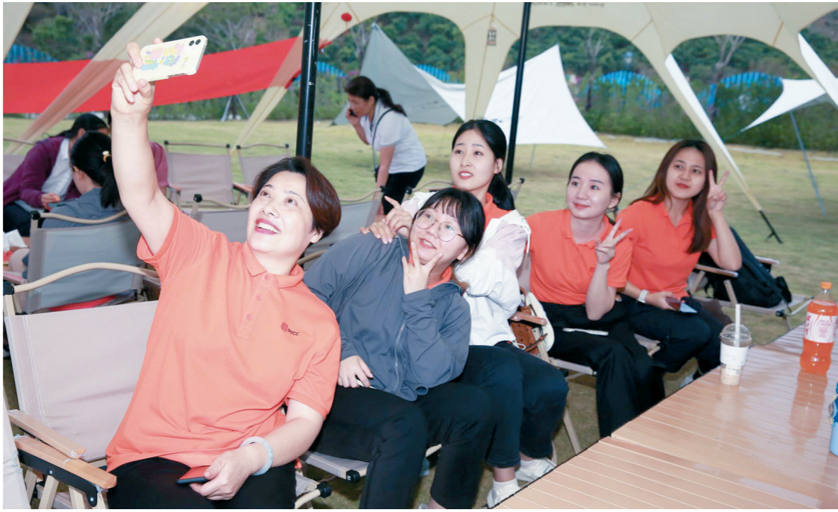
3月8日,在绿野星空营地,女职工们自拍留念。

当“悦己”成为女性消费的新态度,“她经济”开始加速升温。“三八”国际妇女节来临,三亚各企业借势推出各类促销活动,拉动消费,掀起“她经济”热潮。