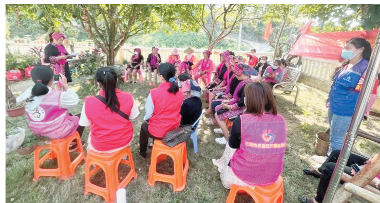
巾帼宣讲员为苗族妇女群众宣讲党的二十大精神。

天涯区妇联负责人表示,为推动党的二十大精神落地生根、见到实效,下一步将继续发挥联系妇女群众的桥梁纽带作用,通过群众喜闻乐见的方式,在天涯区各个片区宣讲。