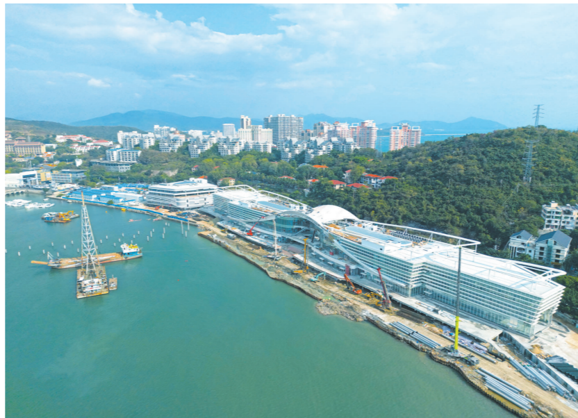
2月20日,航拍正在进行园区绿化等建设工作的三亚国际游艇中心项目。

产业创新跨界融合是本次展会的又一亮点。在新能源游艇以及配套设备和材料专区跨界融合专区,游艇制造企业、设计机构、创新研究机构以科创开辟新赛道,推动游艇产业发展擦出新“火花”,促进跨界融合形成研发到产品落地高效双向循环。