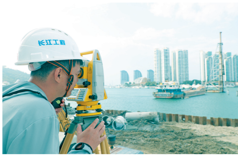
2月20日,技术员为正在建设中的三亚国际游艇中心项目进行测量定位工作。