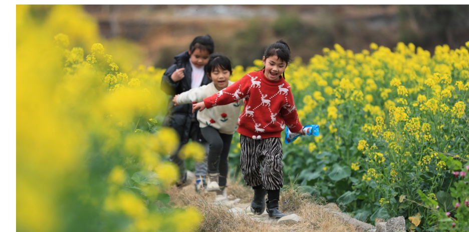
2月19日，小朋友在贵州省从江县洛香镇上皮林村的油菜花田间玩耍。