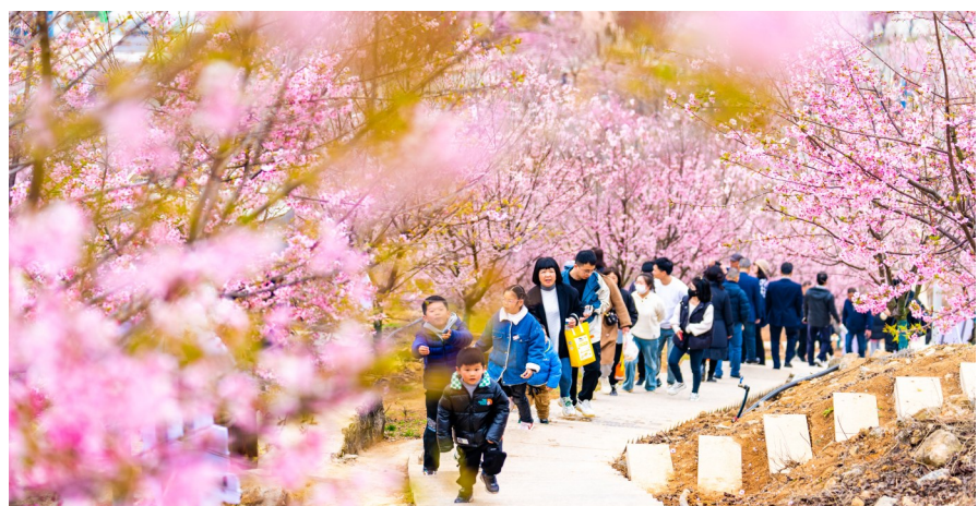
2月19日，游客在浙江省瑞安市桐浦镇桐浦凤凰樱花谷游玩赏花。