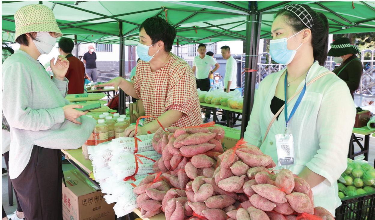
各种特色农产品吸引了众多居民驻足选购。

市热科院相关负责人介绍,开展农产品进社区活动,为居民带来本地特色农产品展销。同时,让更多人了解到该院培育生产的芽苗菜、水培蔬菜等特色农产品,有利于促进市民便利消费、安全消费、放心消费。当天,该院全体党员及相关工作人员进行了芽苗菜、冬瓜、南瓜、樟树港辣椒、番茄、水培蔬菜等农产品现场销售,价格优惠,质量保证,现场参与选购的市民把农产品“一扫而空”。