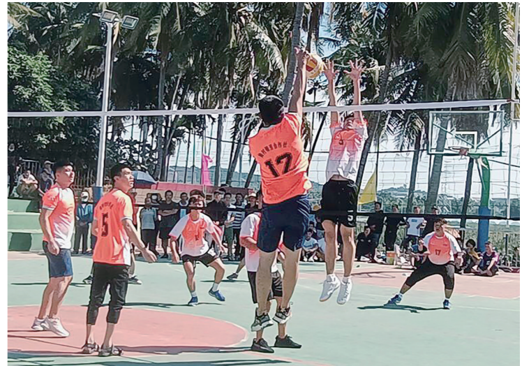
梅村村春节排球赛进行中。

本报讯(记者 黄世烽)春节期间,三亚天涯区多个村举办了丰富多彩的文体活动,给广大村民带来了更多的节日欢乐。