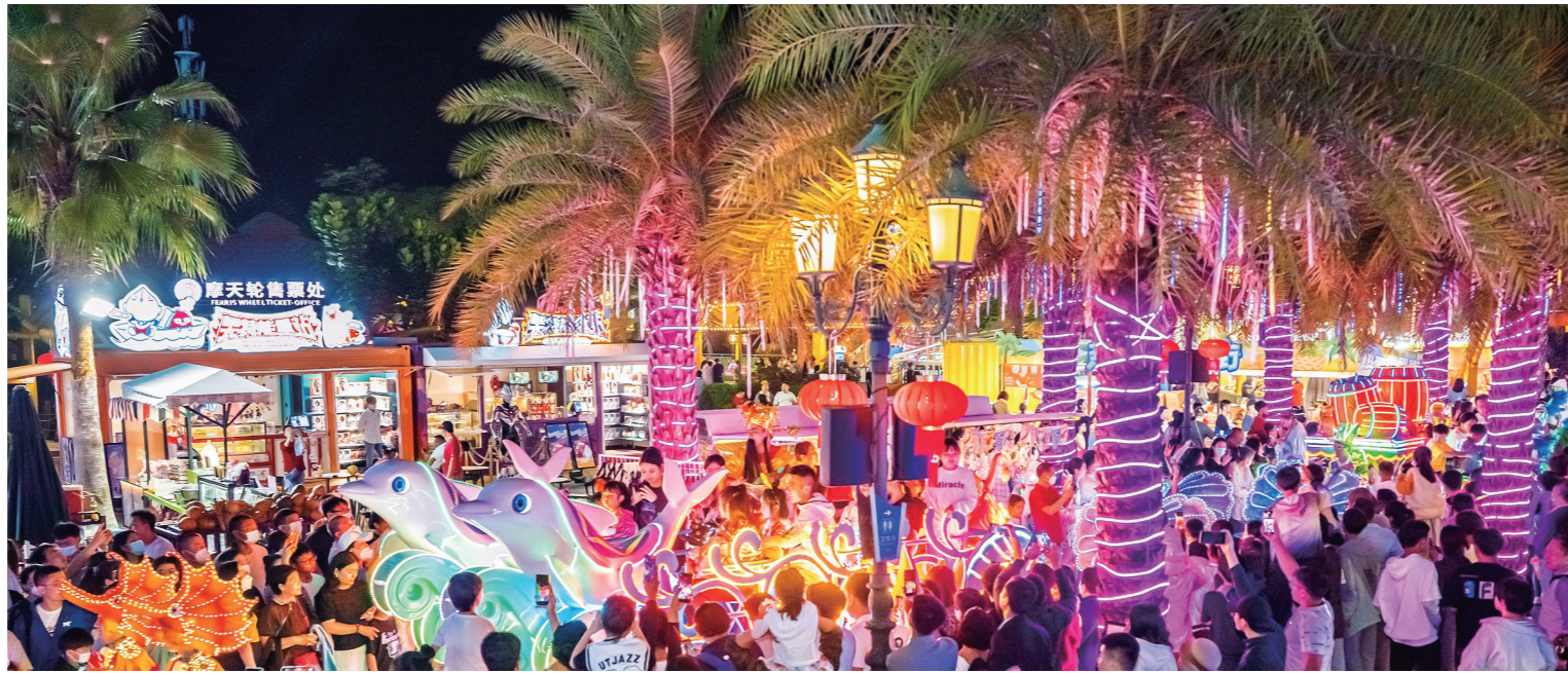
1月24日晚,三亚海昌梦幻海洋不夜城,众多游客正在欣赏夜光花车巡游活动。

节日活动精彩纷呈、旅游市场人气旺、离岛免税销售火爆……今年春节期间,人民日报、新华社、中央广播电视总台等央媒组团高频聚焦三亚。从红火的节日旅游市场,到各行各业默默奉献的工作者,火热的三亚成为央媒报道的热点,本报记者梳理各大央媒春节期间刊播的近20篇三亚报道,通过央媒角度看三亚。