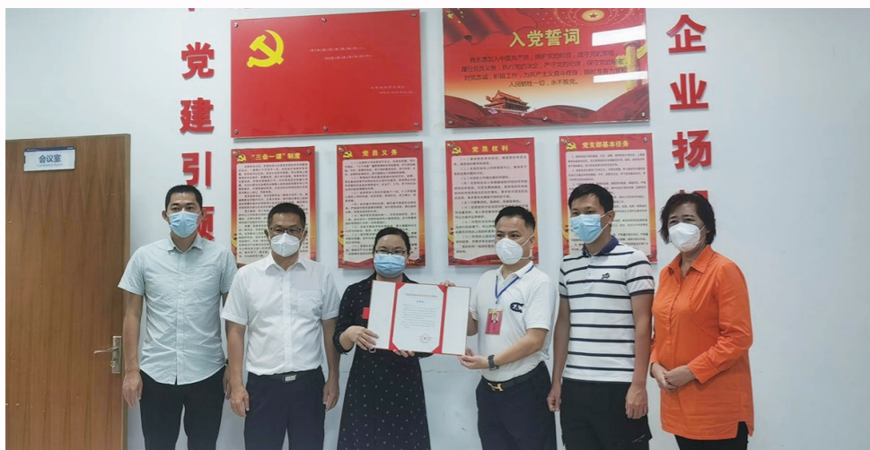
超市和安保人员受到表彰。