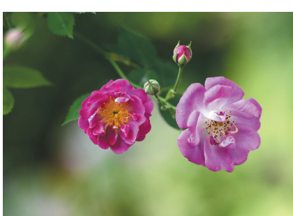
蔷薇花开