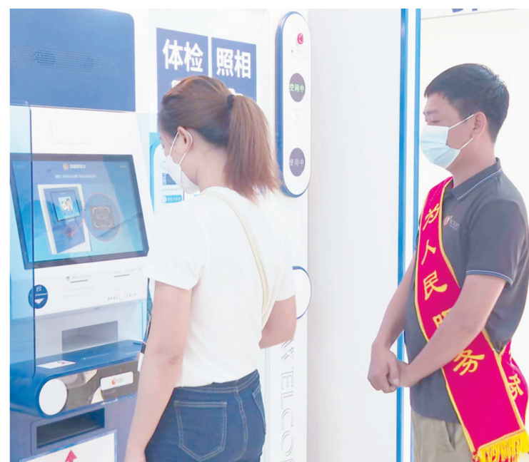
导办员在指导市民使用自助设备。

本报讯(记者 刘盈盈 通讯员 张海哲)近期,为持续深化公安交管“放管服”改革,助力海南智慧城市建设,三亚交警持续推进“智慧车驾管”建设。