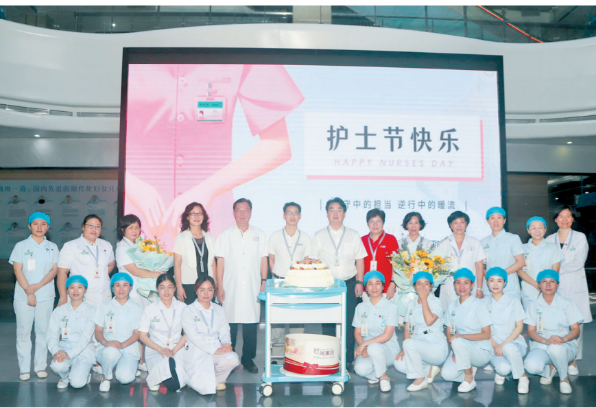
5月11日下午,市妇女儿童医院领导带着蛋糕和鲜花逐一到各临床科室对护士们进行慰问。

本报讯(记者 卢智子)“我宣誓,我志愿献身护理事业,奉行革命的人道主义精神,坚守救死扶伤的信念,履行保生命、减轻痛苦、促进健康的职责……”在第111个“5·12”国际护士节来临之际,三亚各医疗机构先后多形式开展庆祝活动,展现三亚护理工作者的良好精神风貌和职业风范,进一步关心爱护护士队伍,激励广大护理人员守护人民群众健康。