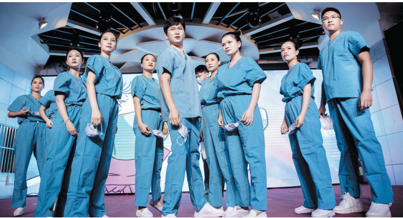
5月10日下午,三亚市人民医院举行庆祝国际护士节暨表彰典礼。