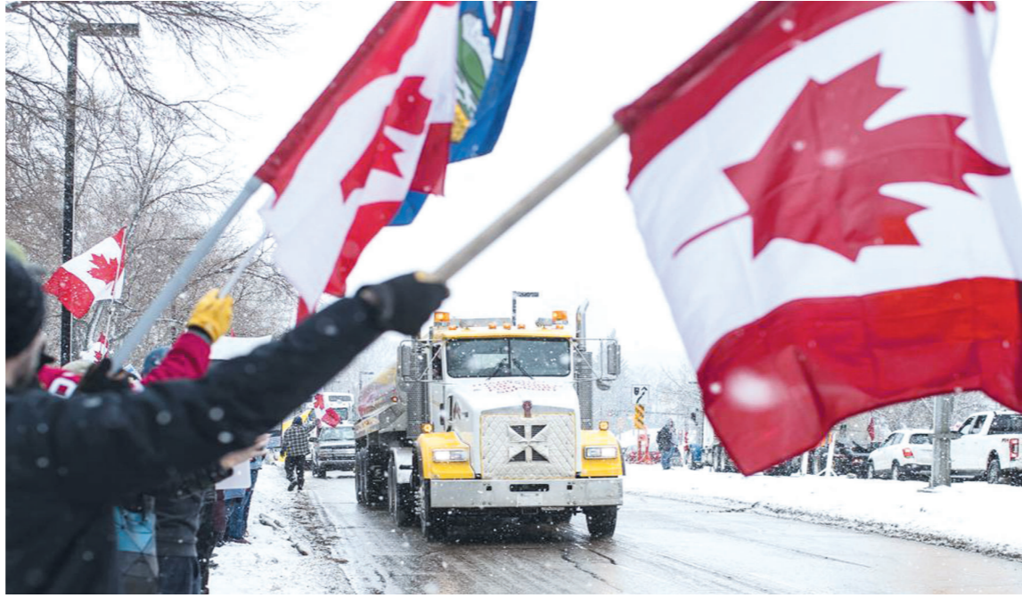
2月6日,加拿大卡车司机在渥太华持续举行示威。

一些美国政客为这场发生在邻国的示威活动摇旗呐喊。美国一名前驻加拿大大使呼吁部分国内政客不要为自身政治利益煽动示威、干涉加拿大内政。