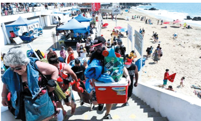
右图:汤加火山爆发后,智利地方当局发出海啸预警,在海岸边游玩的人们纷纷撤离。