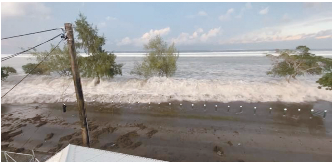
上图:火山爆发后,汤加检测到海啸出现。