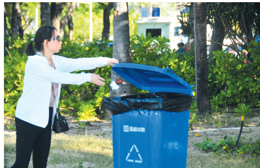
红榜: 这个行为值得点赞

在三亚湾椰梦长廊,一名游客主动将垃圾放进垃圾桶。 元旦假期第二天,三亚阳光明媚,适合出游,不少市民游客到各个景区游玩。各景区景点整洁干净,文明旅游宣传标语随处可见,市民游客自觉维护旅游环境……“文明旅游”成为三亚市2022年元旦旅游景点一道靓丽的风景线。