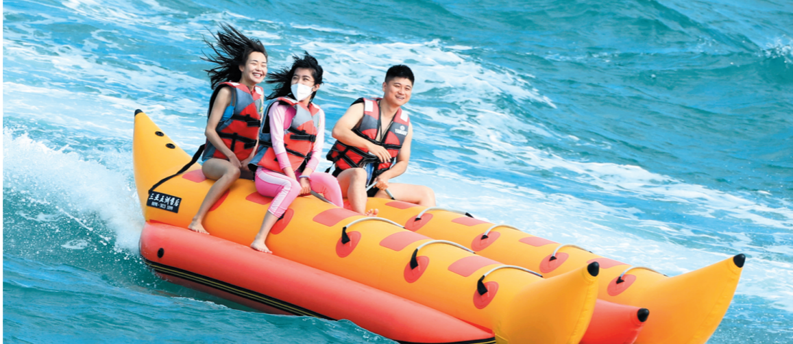
一月一日,三亚西岛海域,游客正在开心体验海上运动项目。

新玩法、新去处、新线路……这个元旦假期,三亚海上娱乐“艇好玩”。1月1日,“扬帆之星”号游艇、西岛008游艇、帆船等5艘不同型号的游船承载着100多位游客在蔚蓝的大海上遨游,船上不时传出阵阵欢声笑语。 “今天有湖北武汉老家的亲友来三亚旅游,我陪他们体验了一下‘自由行观光+度假+体验’的全新旅行产品……大家玩得很开心。”在三亚工作了4年的资深旅行家杨威高兴地说。 杨威感慨道,以前提起游艇,只会让人想起“奢侈、高端”的词语,但现在三亚推出了一批平民化、大众