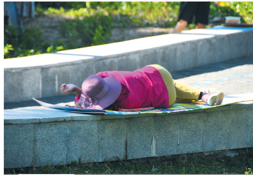
黑榜: 这个“睡姿”很不雅

在三亚湾椰梦长廊,一名游客主动将垃圾放进垃圾桶。 元旦假期第二天,三亚阳光明媚,适合出游,不少市民游客到各个景区游玩。各景区景点整洁干净,文明旅游宣传标语随处可见,市民游客自觉维护旅游环境……“文明旅游”成为三亚市2022年元旦旅游景点一道靓丽的风景线。