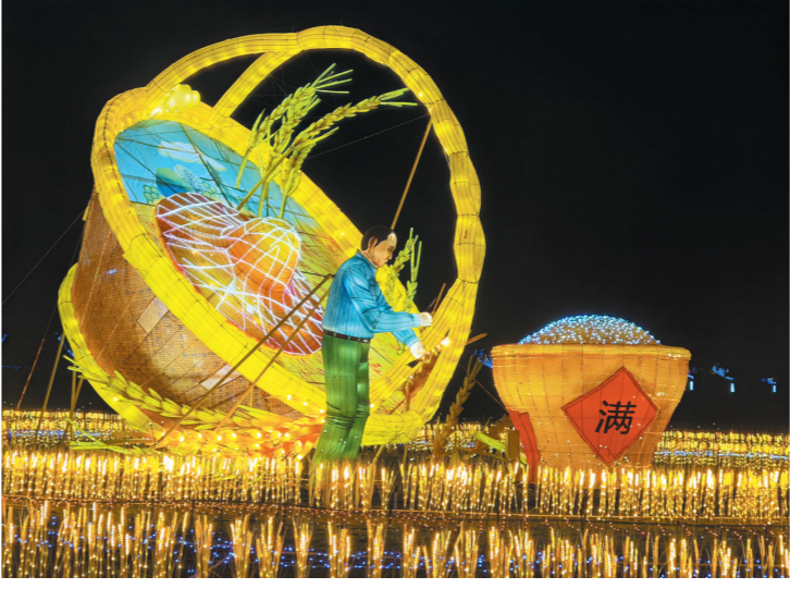
以大地为纸、水稻为笔勾勒出的大型3D彩色稻田画。

“三星堆”主题展区等50个不同主题的灯光展区,让游客在2800亩的稻田花海边,与323只活灵活现、栩栩如生的远古恐龙奇幻景观一起,体验美轮美奂的“稻田奇妙夜”。 三亚水稻国家公园“稻田奇妙夜”夜场灯展打造多维视觉体验,灯展活动从观看到体验进行全新升级,突出灯展的国际化、民族化、现代化,同时还推出商业、特色美食等配套体验,夜间的古朴小火车穿行在稻田花海间,更增添了灯展的浪漫色彩。 此外此次灯展作为景区夜间经济的主体项目,时间将持续至今年5月,营业时间每天17:30至22:30,不同场景的文化及互动体验融合,使“稻田奇妙夜”成为岛内游的热门打卡地。 灯展吸引了不少市民游客前来观赏,游客肖女士说:“去年过年的时候我来过一次,今年的布置比之前要更漂亮一些,灯光布置也特别绚烂多彩,马上就要过年了,这里让我感受到了年的氛围。” (吴英模 文/图)