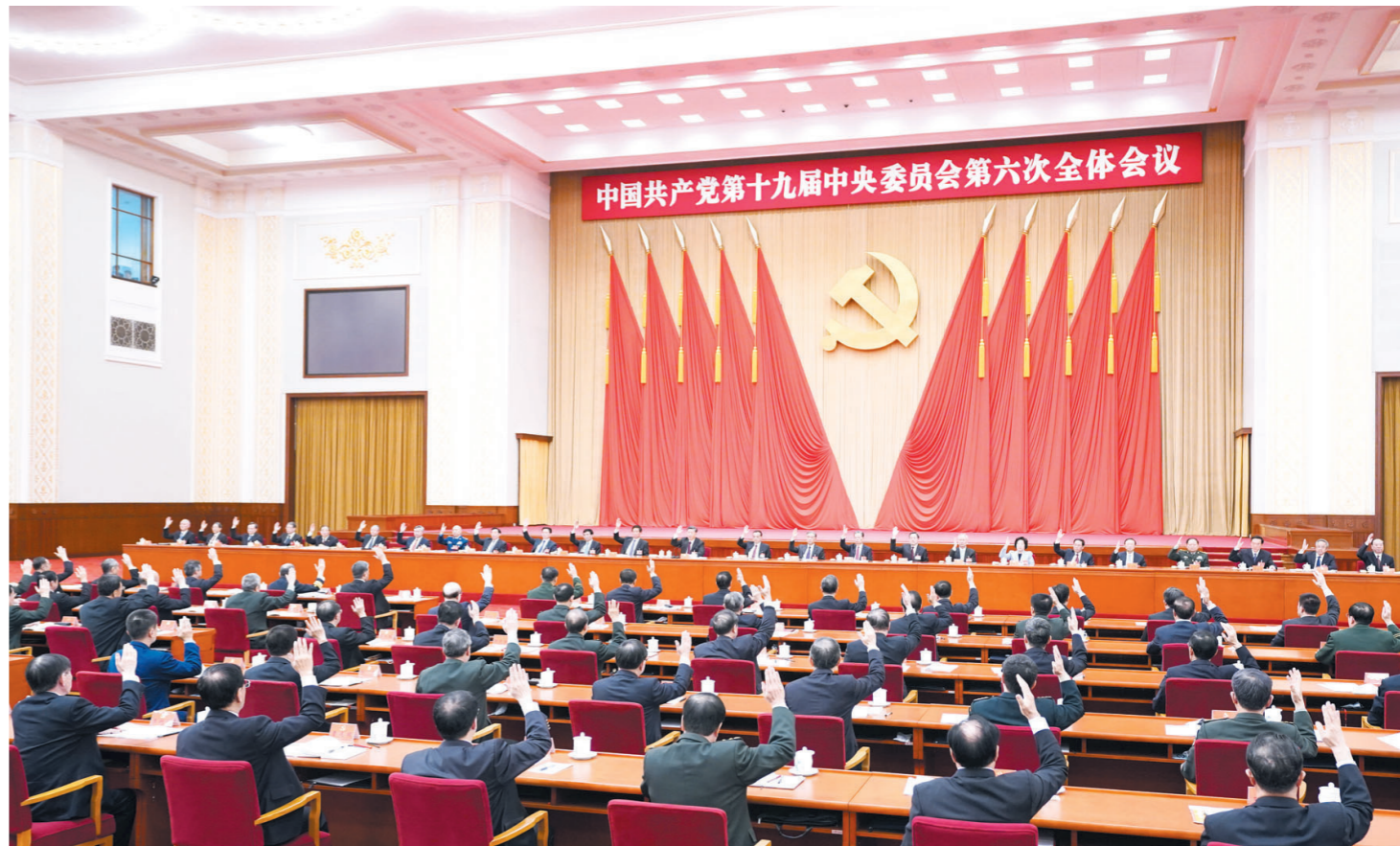
中国共产党第十九届中央委员会第六次全体会议,于2021年11月8日至11日在北京举行。中央委员会总书记习近平作重要讲话。