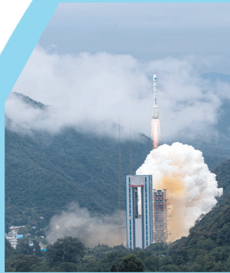
2020年6月23日,我国北斗三号全球卫星导航系统最后一颗组网卫星在西昌卫星发射中心点火升空。