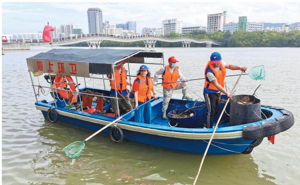
志愿者在三亚河打捞垃圾。

自“创文”工作启动以来,天涯区结合党史学习教育,大力推进“党建+志愿服务”模式,得到天涯区各基层党组织和社会各界的积极响应,充分调动党员干部、网格员和群众参与“创文”志愿服务活动的积极性,不断为三亚市创建全国文明城市赋能增效。