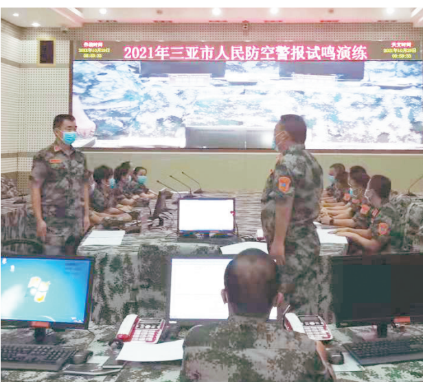
▲指挥员在组织指挥防空警报试鸣及演练活动。