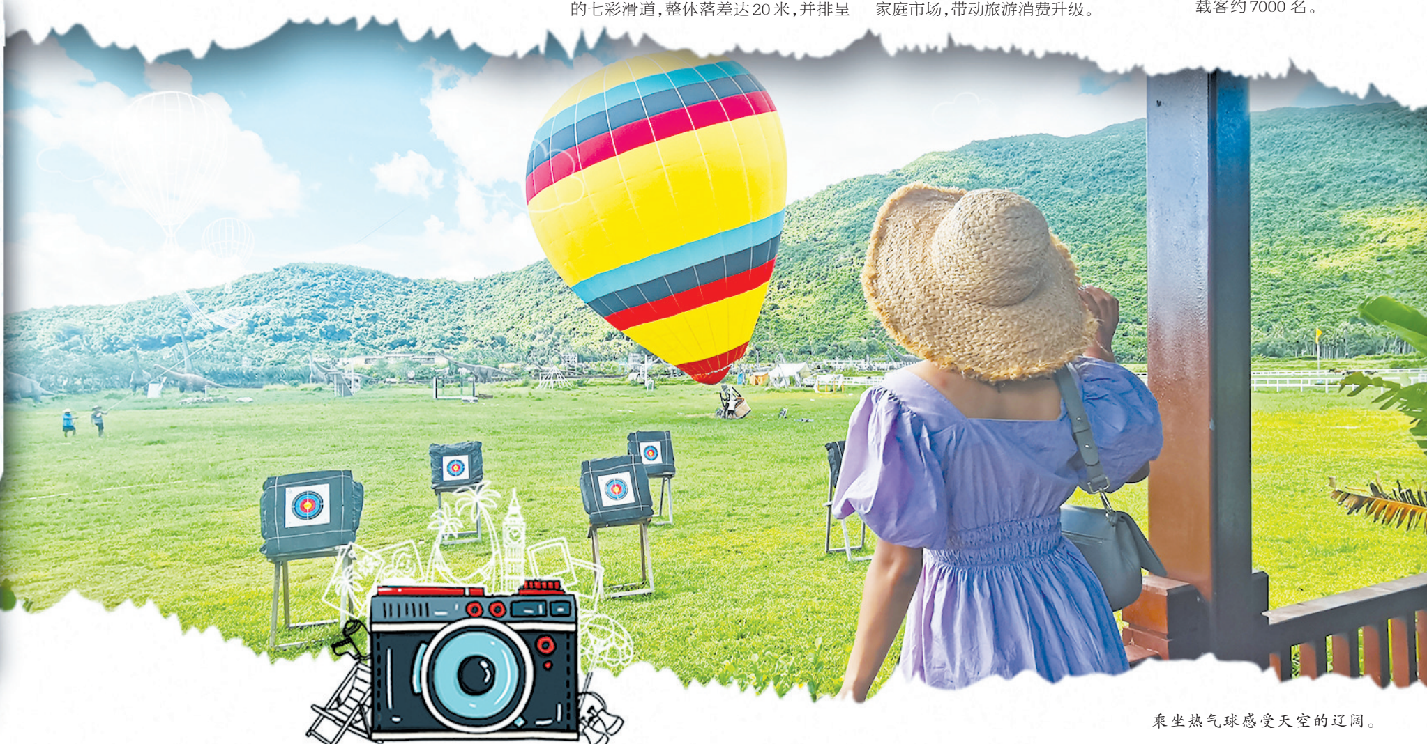
乘坐热气球感受天空的辽阔。