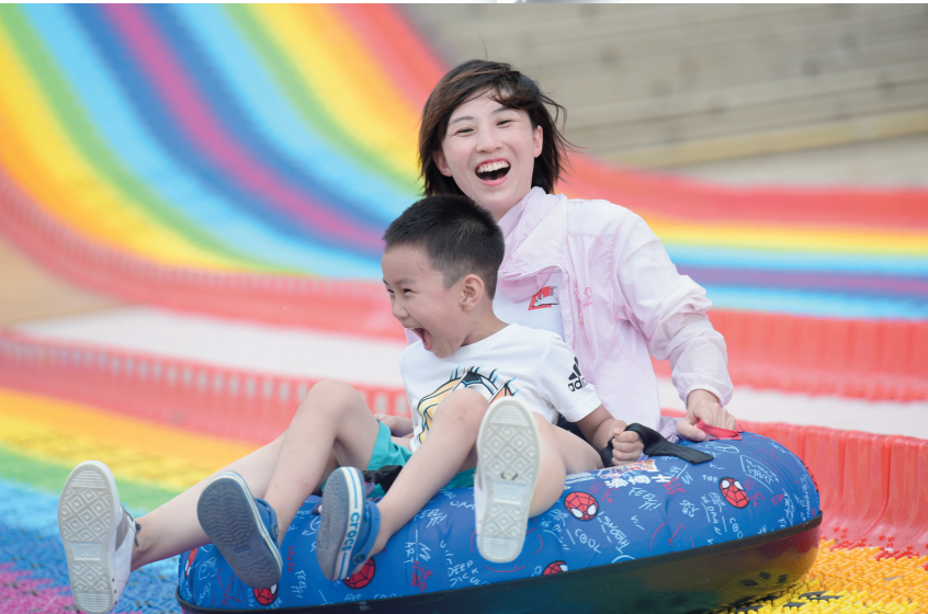
“彩虹滑道”尽享鹿城浪漫。

如今在博后村可以看到,除了黎族文史馆、文创基地、哎呷湖露营运动公园、农业观光园、游客中心等公共场所空间,村道边三五步就是超市或便利店,租车公司、药店、奶茶店等门店俱全。连锁店、农家乐、火锅店等餐饮饭店村里开有十几家。夜幕降临时,村道两侧摇身变为烟火气息浓厚的夜市,地摊小吃、高端酒吧等丰富夜生活,不光吸引本村民宿住客,还吸引亚龙湾域内酒店住客前来。而村内众多民宿也不再仅仅是局限于住宿一项服务,还贴心地推出了全套旅拍、旅游定制、机场接送等多项附加服务。