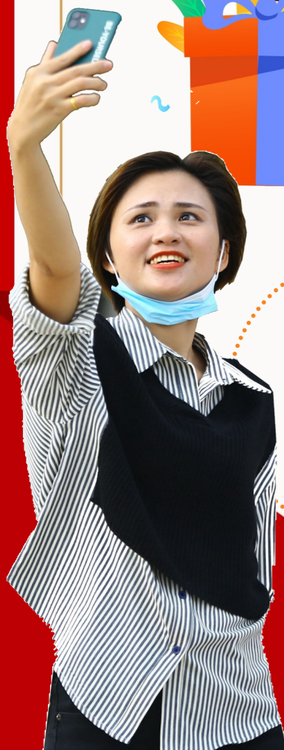
11月4日，游客在三亚南山文化旅游区自拍。