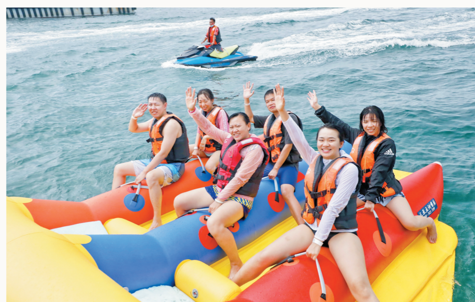
三亚蜈支洲岛旅游区，游客在体验海上项目。

冬季暖如春，正是出游三亚好时节。在景区方面，三亚各大热门景点也瞄准“双11”大促机会，推出了多款景区优惠活动。三亚海棠梦幻海洋不夜城推出“包季”福利，“双