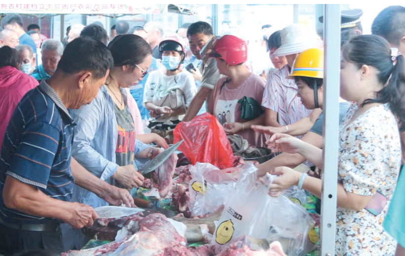
爱心扶贫大集市场。

本报讯(记者 符吉茂)8月28日，三亚市“消费扶贫月”暨爱心扶贫大集市活动崖州区专场开市。崖州区相关“带货”合作社、建档立卡户共携带30余种农产品参加活动，实现销售总额76603元。崖州区委相关领导到扶贫集市调研并带头“买买