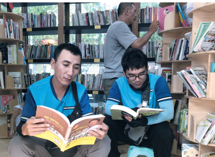
外卖小哥在党建书吧读书已成习惯。