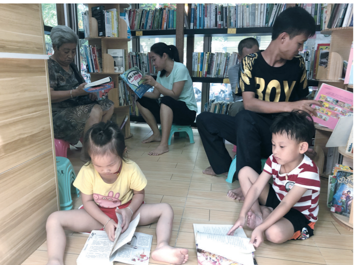
党建书吧内,大人孩子在阅读。