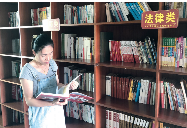
居民正在阅览室内读书。