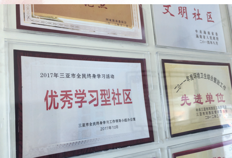
金鸡岭路社区被评为“优秀学习型社区”。