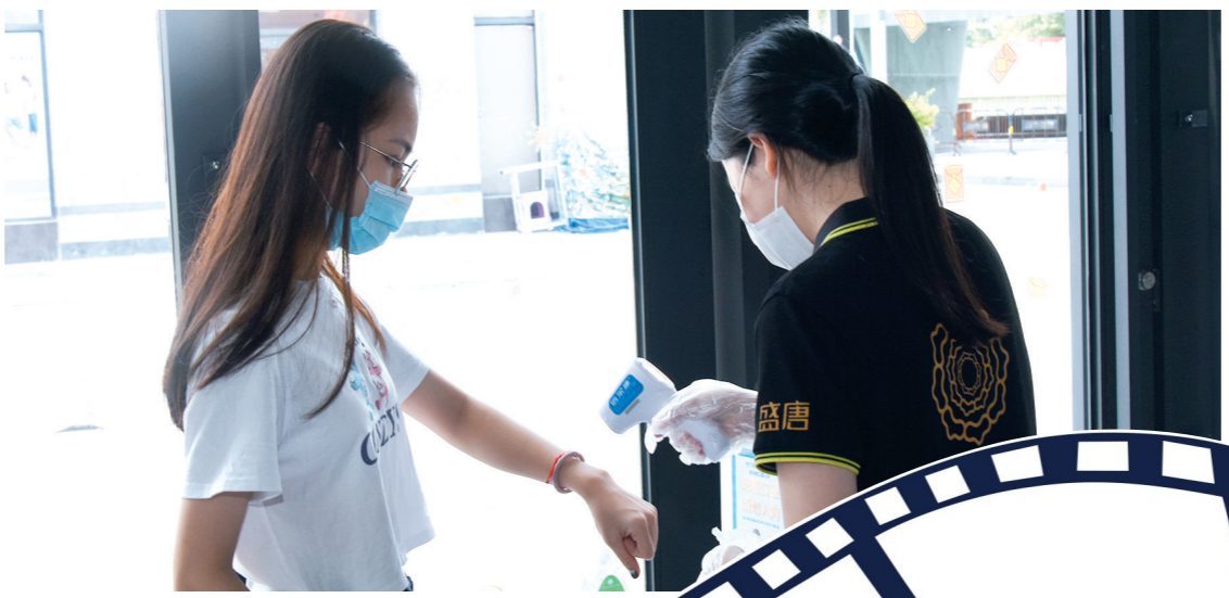
7月20日下午,在三亚乐天成盛唐时代国际影城入口,工作人员给进入影城的影迷测量体温。