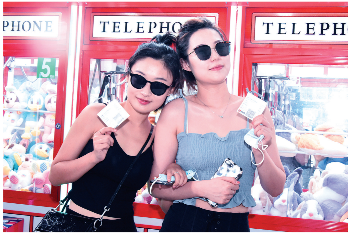
7月20日下午,在三亚乐天成盛唐时代国际影城,影迷展示购买的电影票。