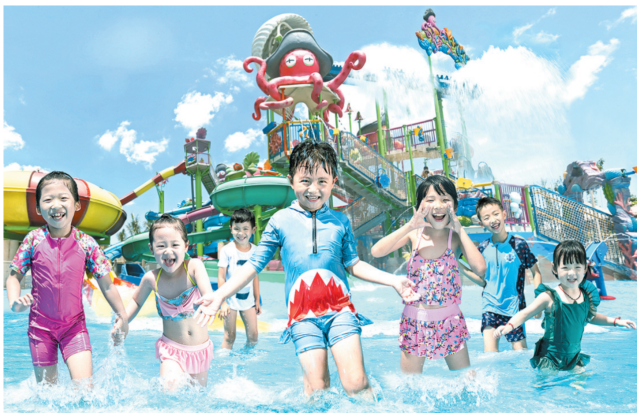
三亚酒店在以往“住”的功能基础上,融入“娱乐”“美食”等旅游新业态。图为小朋友们在三亚·亚特兰蒂斯水世界玩耍。

在三亚海棠湾君悦酒店,住店的客人则可带孩子感受古朴渔村的海滨风光;入住三亚澳卓雅酒店公寓,可让游