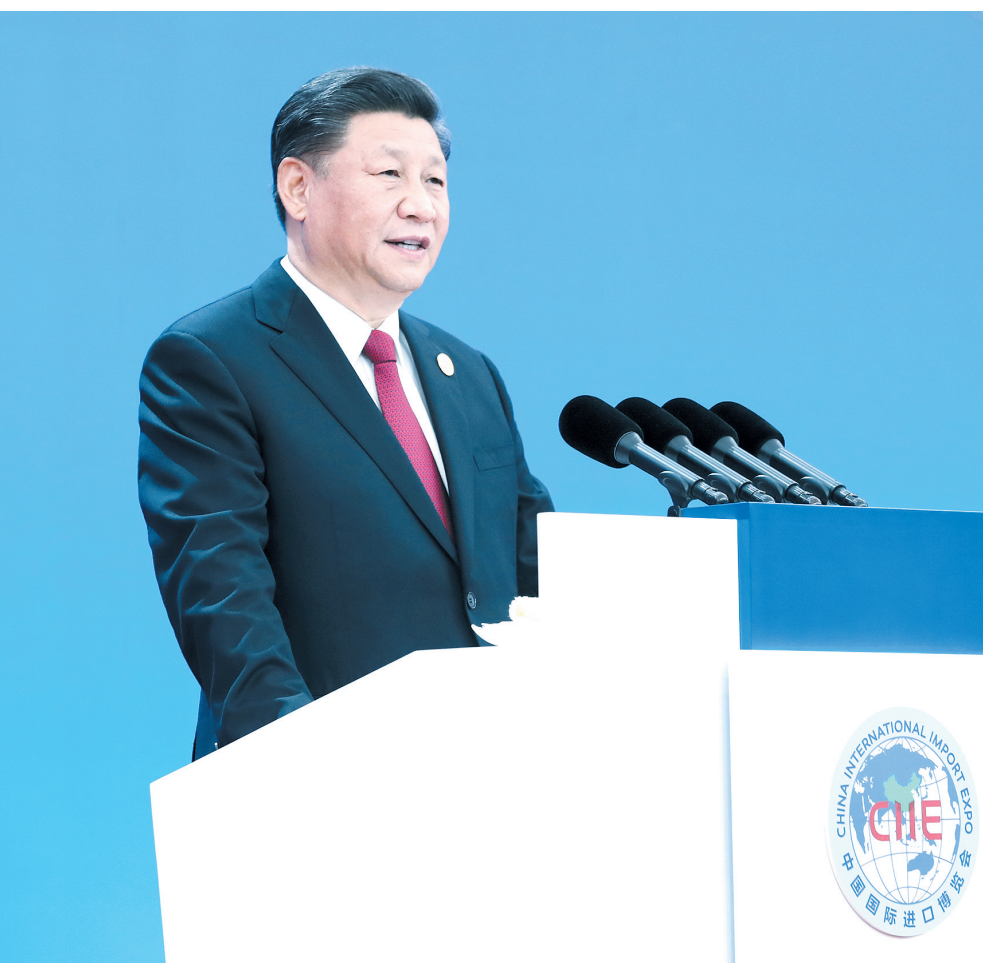
11月5日,第二届中国国际进口博览会在上海国家会展中心开幕。国家主席习近平出席开幕式并发表题为《开放合作 命运与共》的主旨演讲。