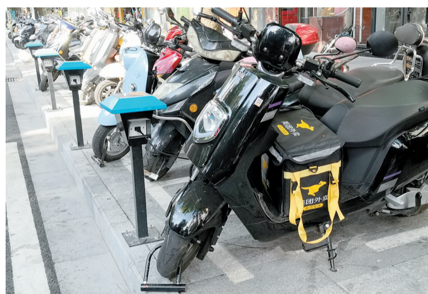
吉祥街新设置的电动车充电桩。

本报讯(见习记者 陈聪)近日,有细心的市民发现,三亚市街道、公路边的电动车停车位上增设了很多充电桩,既解决了充电难的问题,又能预防电动车不规范充电带来的安全隐患。