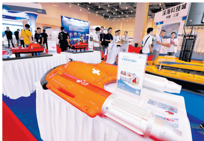
“海豚1号”水面救生机器人。

本报讯(记者 孙梦璐)亮眼的“肤色”、酷似船头的外观,依托技术力量更加安全且快速救生的目的……10月25日,在2019国际海洋科学技术装备展上,由云洲智能科技有限公司展出的“海豚1号”水面救生机器人以其独特的造型和实用的功能吸引了大家的注意力。