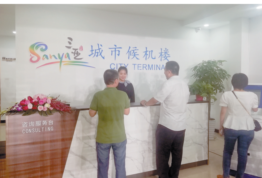
右图:三亚首个城市候机楼正式营业。

三亚市旅游行业协会联合会主席刘凯强说:“目前,绝大部分酒店退房规定是在下午1点前,而三亚凤凰机场主要航空高峰期是晚间5点至8点之间,旅客在离岛当天有4至7小时无法有效支配,而三亚城市候机楼的建设正是精准解决了这一痛点。它不仅能够让旅客节省机场等待及办理繁琐工序的时间,同时还可以为其离港前提供娱乐、餐饮、休闲、购物、快递、自助值机、行李托运等的服务,为大三亚旅游和该区域周边其它产业的发展带来乐观的机遇。”