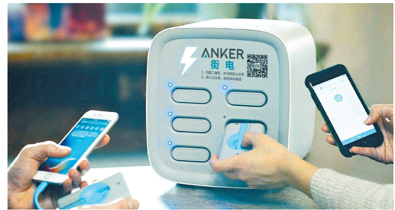
共享充电宝为生活带来便利。

本报讯(记者 罗略榕)近日,有网友反应多个共享充电宝品牌涨价,有的甚至上涨至5元/小时。8月20日,三亚日报记者走访了三亚多个商场、商业区,发现三亚的共享充电宝市场基本被街电、小电、来电、怪兽充电等品牌占据,价格基本稳定在2元/小时左右。目前,共享充电宝的计费标准是否合理?如果涨价会影响消费者的利益吗?对此,三亚日报记者采访了消费者和行业相关人士看法。