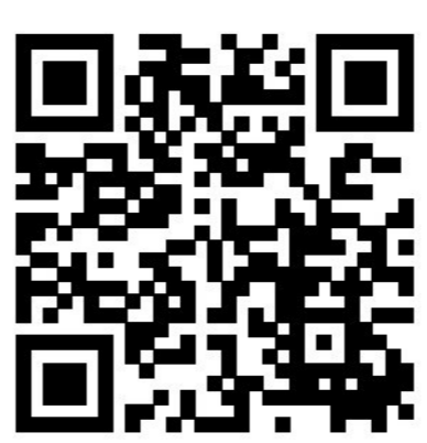
“我和我的祖国”作品投稿请扫以上二维码。

另外,《三亚日报》面向广大读者征集“我和我的祖国·我的笑脸”图片,只要是能反映个人成长过程中的某件值得庆祝的大