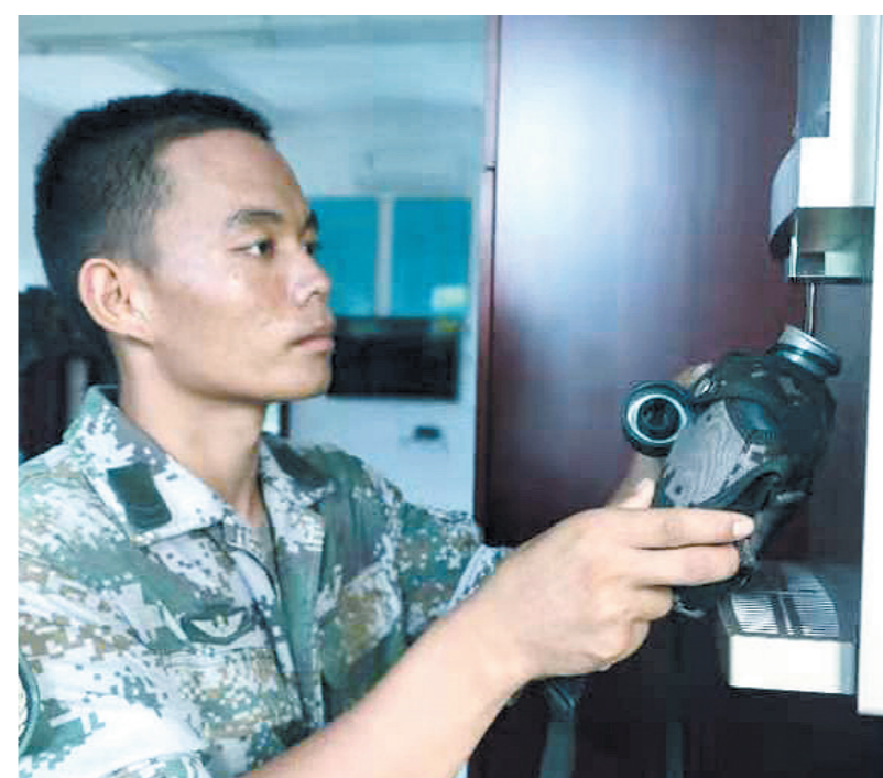
官兵在房间喝上放心水。

三亚日报记者在现场看到,产生的生态水通过直饮水管线直接通往班排,官兵们在排房就可以喝到纯净、可口的高品质饮用水,而且官兵们还可以根据需