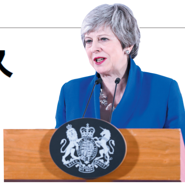
4月11日,在比利时布鲁塞尔,英国首相特雷莎·梅在新闻发布会上讲话。

特雷莎·梅认为,欧盟此次提供的灵活延期方案对英国至关重要。她重申,英国应尽快实现有协议“脱欧”。她将于11日向英国议会下院做相关陈述,并呼吁国内各方尽快就符合国家利益的“脱欧”协议达成一致。