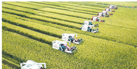
江苏省淮安市盱眙县黄花塘镇老营“虾稻共生”示范基地收获水稻(2018年9月20日摄)。

运行稳中有变、变中有忧,外部环境复杂严峻,经济面临下行压力,前进中的问题必须有针对性地解决。”宁吉喆说。