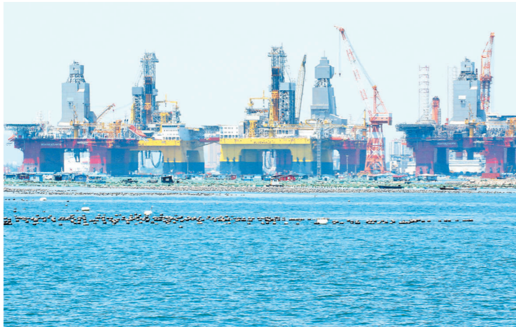
在中集来福士山东烟台建造基地,多座半潜式钻井平台在施工中(2018年6月29日摄)。

点任务扎实推进,经济结构继续优化,最终消费支出对国内生产总值增长的贡献率为76.2%。