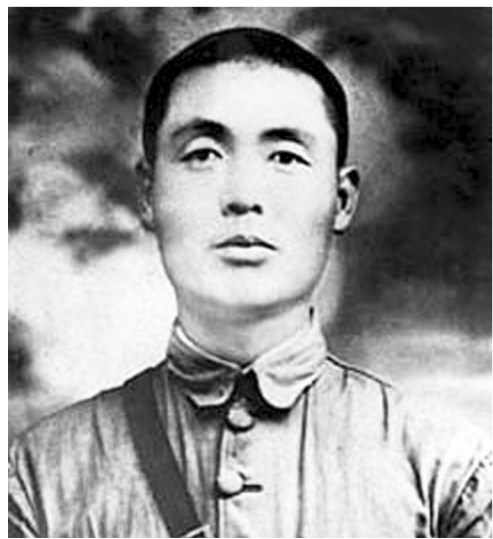
为了民族复兴·英雄烈士谱

1935年6月,第一、四方面军会师后第5军团改称第5军,董振堂任军长。1936年10月红军三大主力在会宁会师后,红5军被编入西路军,向宁夏、甘肃、新疆方向进发。1937年1月12日,董振堂率部在甘肃高台县城与六七倍于己的敌人浴血苦战,战至最后一人一弹,于20日壮烈牺牲。时年42岁。